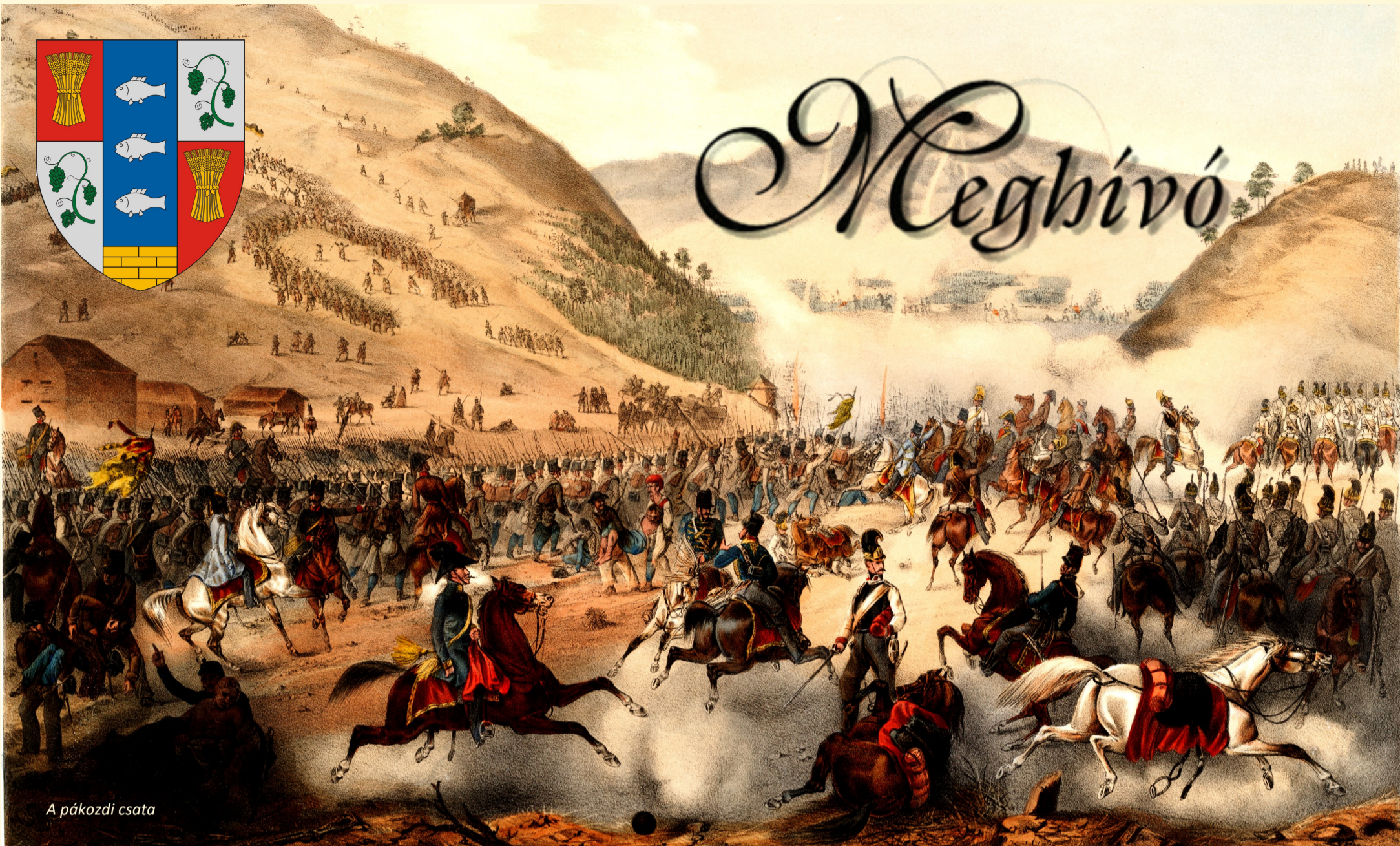
A pákozdi csata

Pátka Község Önkormányzata meghívja Önt és kedves családját az 1848. szeptember 29-ei Pákozd-Sukoró-Pátkai csata 174. évfordulóján tartott megemlékezésre